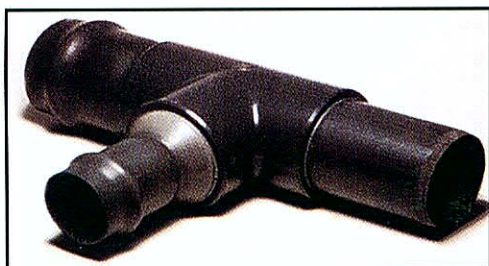
TEE NTP - ISO UF CON REDUCCIÓN